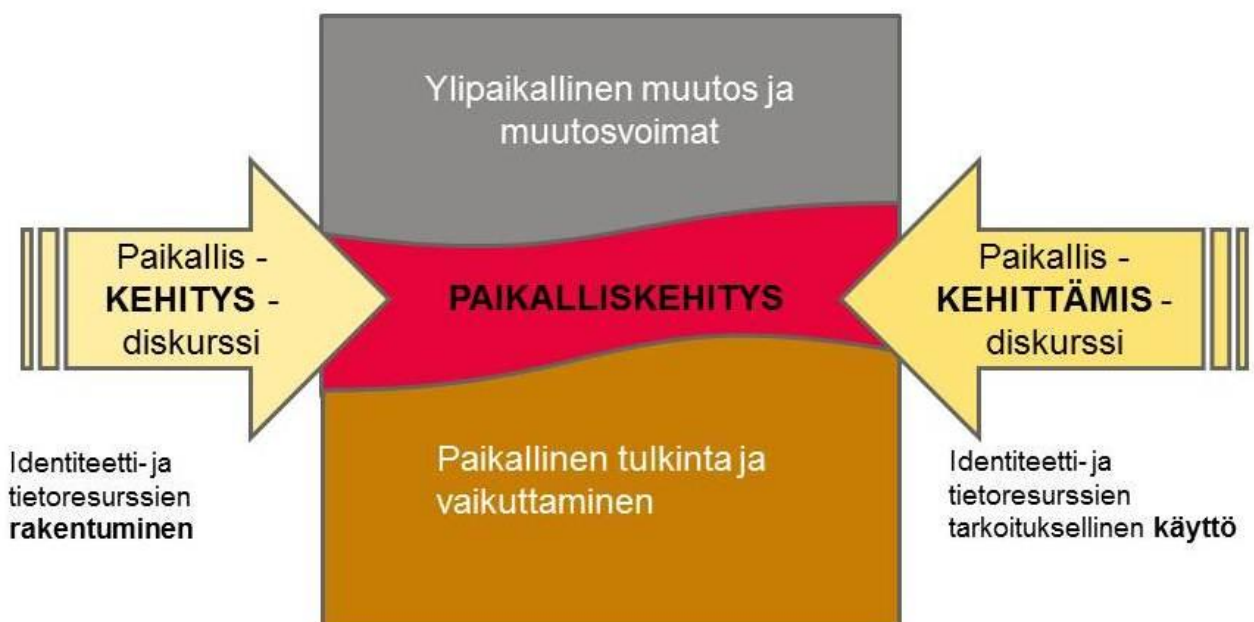
Kuva 1. Tutkimusasetelma.

Paikalliskehitysdiskursseista erotimme a) historian pitkien kaarien kerronnan ja b) ajankohtaisen puhunnan paikallisesta kehittämisestä ja sen tulevista suunnista. Asetelma muodostui näin kahdesta eri tavoin konstruoituvasta, mutta toisiinsa liittyvästä paikallisdiskurssista. Nimitämme ensin mainittua paikalliskehityksen ja toista paikalliskehittämisen diskurssiksi (kuva 1).